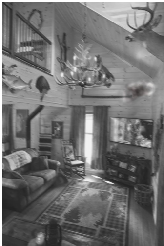
Fig 1 : Extrait de la vidéo initiale

La vidéo n'avait pas vraiment rencontré d'écho durant quelques jours jusqu'à ce que le septuagénaire se soit rendu à l'hôpital pour se faire soigner, et qu'une assistante sociale vienne vérifier que le vieil homme ne perdait pas trop les pédales.